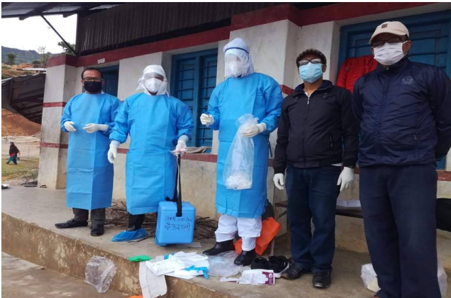
कोभिड-१९ उपचार तथा रोकथाममा खटिएका स्वास्थ्यकर्मीहरु