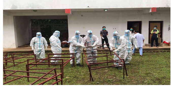
आइसोलेसन केन्द्रमा खटिएका स्वास्थ्यकर्मीहरू