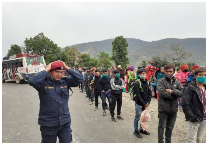
जिल्ला बाहिर अलपत्र परेकाहरुलाई उद्धार गरी जिल्ला लिनै गरेको