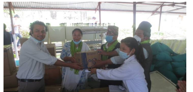
माननीय सभापति जयपुरी घर्ती ज्यूबाट स्वास्थ्य सामग्री हस्तान्तरण