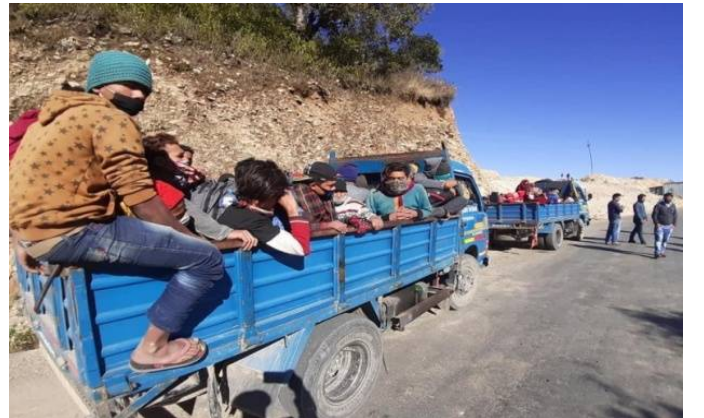
वीच बाटोमा अलपत्र परेकाहरुलाई स्थानीयबाट उद्धार गर्दै ।