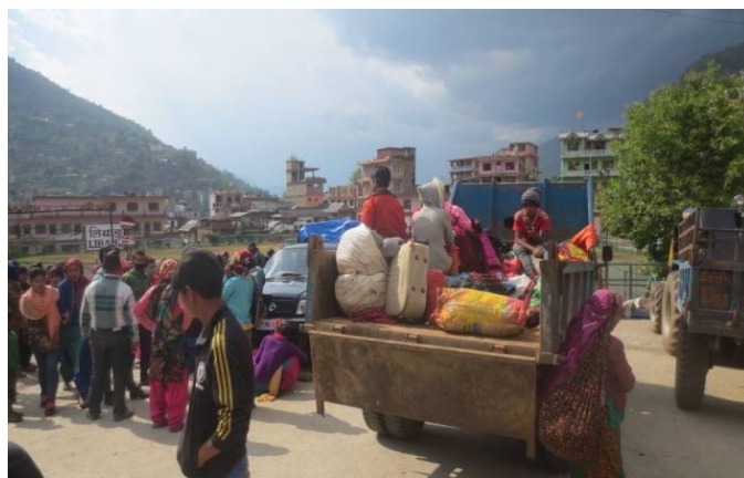
जिल्ला बाहिर अलपत्र परेकाहरुलाई उद्धार गरी जिल्ला लिनै गरेको

१६. नेपाल सरकारद्वारा जारी गरिएको लक डाउन पश्चात रोल्पा जिल्लामा भारत तथा अन्य तेस्रो मुलुकबाट आएका व्यक्तिहरुको पहिचान गरी Quarantine तथा Isolation मा राख्ने कार्य सम्पन्न गर्नुका साथै स्वाब परिक्षण गर्ने व्यवस्था मिलाइएको ।