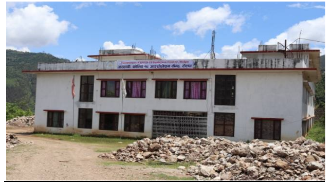
जलजला बह्मुखी क्याम्पसमा संचालित आइसोलेशन केन्द्र

१०. जिल्ला स्तरिय Isolation मा हालसम्म ७० जना कोभिड-१९ संक्रमण भई हाल आईसोलेशनमा उपचार गरी ४९ जना निको भई हाल होम क्वारेन्टाइनमा रहेको र हाल २० जना विमारीहरूको उपचार भईरहेको ।