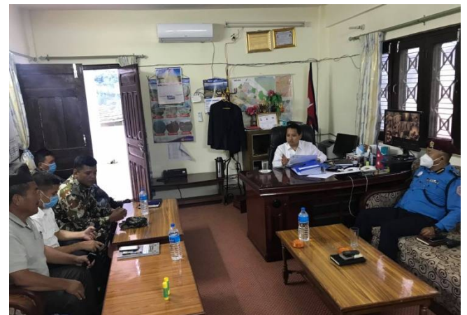
जिल्ला संकट व्यवस्थापन समितिको बैठक