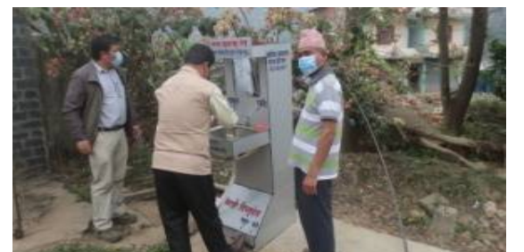
खुट्टाले चलाउने धाराको प्रयोग ।

(ख) स्थानिय रेडियो, एफ.एम., अनलाईन पत्रपत्रिका तथा स्थानिय टेलिभिजनहरूमा कोभिड-१९ भाईरस सम्बन्धि सचेतना मुलक सन्देश प्रवाह गर्न निर्देशन दिएको ।