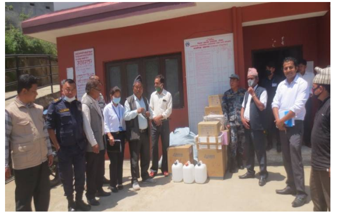
स्वास्थ्य सामाग्री वितरण गर्ने तयारीमा

१९. कोभिड-१९ को संक्रमणको रोकथाम तथा नियन्त्रणको लागि नेपाल सरकारले २०७६ चैत्र ११ गते देखि नेपाल मुलुकभर लकडाउनको घोषणा गरेपश्चात सवारी पासको व्यवस्थापन प्रत्येक जिल्ला प्रशासन कार्यालयलाई जिम्मेवारी तोकेको थियो । नेपाल सरकार प्रधानमन्त्रि तथा मन्त्रिपरिषद्को कार्यालय, CCMC तथा गृह मन्त्रालयबाट प्राप्त आदेश, निर्देशन तथा परिपत्र बमोजिम जिल्ला प्रशासन कार्यालय रोल्पाले सवारी पासको व्यवस्थापन तथा सहजीकरण गर्दै आईरहेको छ । रोल्पा जिल्लामा उपचार हुन नसकि अस्पतालबाट रिफर गरिएका सिकिस्त विरामी, मृत्यू सम्बन्धी काजकिरिया गर्ने क्वारेन्टाईन र आईसोलेशन केन्द्र व्यवस्थापन सम्बन्धी कार्यको लागि सवारी पास जारी गर्दा प्रमुख प्राथमिकता दिईएको । अन्य अत्यावश्यक कार्यको लागि अन्तर जिल्ला तथा काठमाण्डौ उपत्यकामा प्रवेश को लागि सम्बन्धित पालिको सहमति र जिल्ला प्रशासन कार्यालयको अनुमति लिएर मात्र पास जारी गर्ने गरिएको । त्यसै गरी खाद्यान्न अभाव हुन नदिन लयागत अति आवश्यक विकास निर्माणको काममा सहजिकरण गरिएको छ । भारत लगायत तेस्रो मुलुकबाट जिल्ला भित्रिने नागरिकहरूको उद्धारको लागि आवश्यक रूपमा समन्वय तथा सहजिकरण गरिदै आएको छ ।