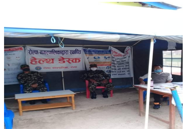
रोल्पा न.पा. टुँडिखेल स्थित हेल्प डेस्क

६. यस जिल्लामा कोभिड-१९ का शंकास्पद विमारीहरु पहिचान गर्न र कोभिड-१९ को भय कम गर्न सबै स्थानीय तहहरूमा जम्मा २१ स्थानहरूमा हेल्प डेस्क स्थापना गरिएको ।