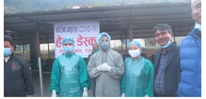
जिल्ला अस्पताल रेउघामा संचालित हेल्प डेस्क ।