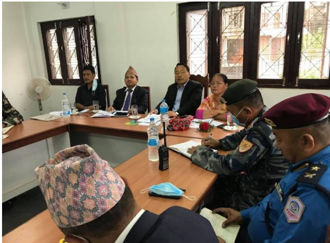
माननीय मन्त्री ज्यूसंग कार्यालय प्रमुखको बैठक