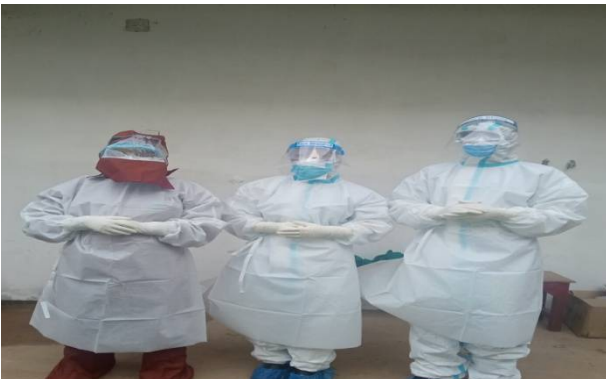
आइसोलेसन केन्द्रमा खटिएका स्वास्थ्यकर्मीहरू