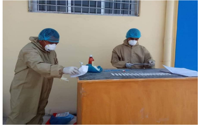
RDT परिक्षण पछि रिपोर्टका लागि तयारी

१४. दोश्रो चरणमा जिल्ला स्तरिय Isolation मा खट्ने भएका स्वास्थ्यकर्मी तथा सहयोगी