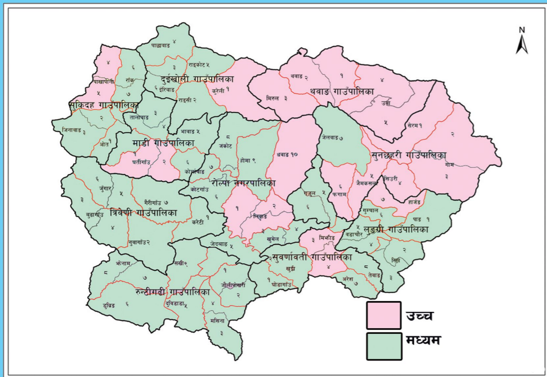
रोल्पा जिल्लामा आगलागिको जोखिम स्तरीकरण