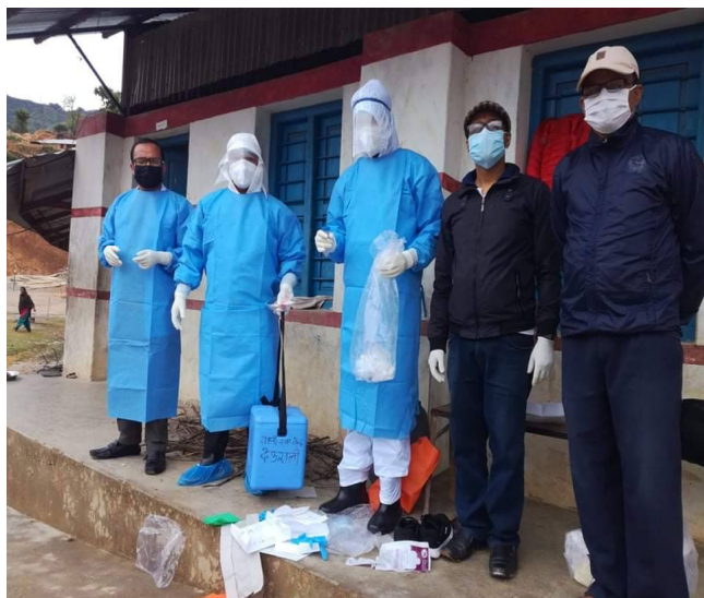
स्वाब संकलन गर्दै स्वास्थ्यकर्मी