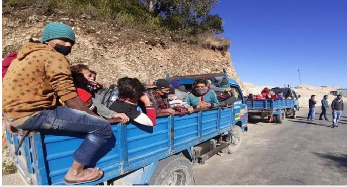
विदेश/अन्य जिल्लाबाट आएका स्थानिय