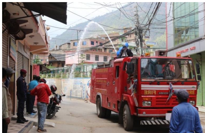
रोल्पा न.पा. ४ स्थित बजार वरिपरि सोडियम हाईड्रोक्लोराईड किटनाशक औषधी छर्किदै