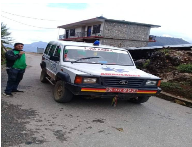
कोभिड-१९ कोरोना भाईरस रोकथाम तथा नियन्त्रणको लागि तयारी हालतमा राखिएको एम्बुलेन्स