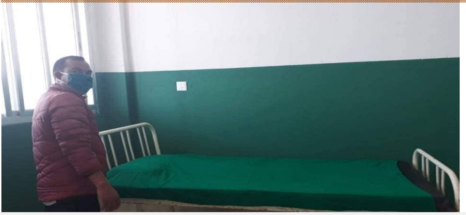
विदेश/अन्य जिल्लाबाट आएका स्थानियको लागि क्वारेन्टाईनको व्यवस्था