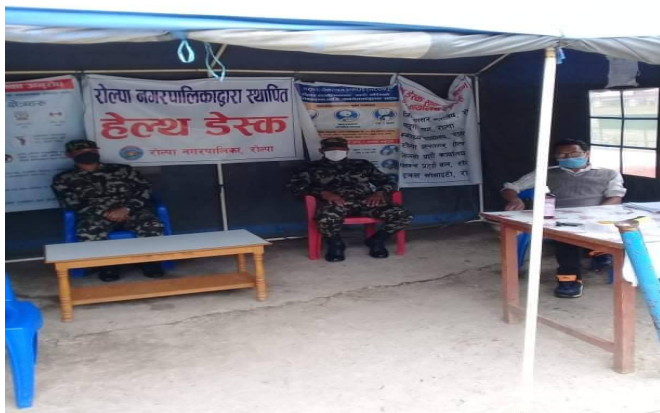
रोल्पा न.पा.मा स्थापना भएको हेल्प डेस्क