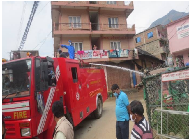
बजार वरिपरि सोडियम हाईड्रोक्लोराईड किटनाशक औषधी छर्किदै

(घ) लक डाउन कार्यलाई पुर्ण रुपमा कार्यान्वयन गर्न नाका तथा सम्बेदनशिल स्थानहरुमा प्रहरी तथा सैनिक तैनाथ गरी भेहिकल र फुट पट्रोल कार्य संचालन गरिएको ।