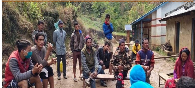
विदेश/अन्य जिल्लाबाट आएका स्थानियको क्वारेन्टाईनमा बस्दै