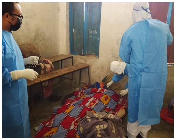
स्वाब संकलन गर्दै स्वास्थ्यकर्मी