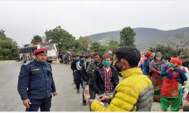
विदेश/अन्य जिल्लाबाट आएका स्थानियहरुको रेकर्ड तथा स्वास्थ्य परिक्षण