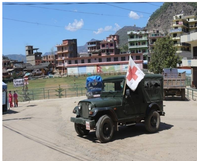
भेहिकल र फुट पट्रोल कार्य संचालन