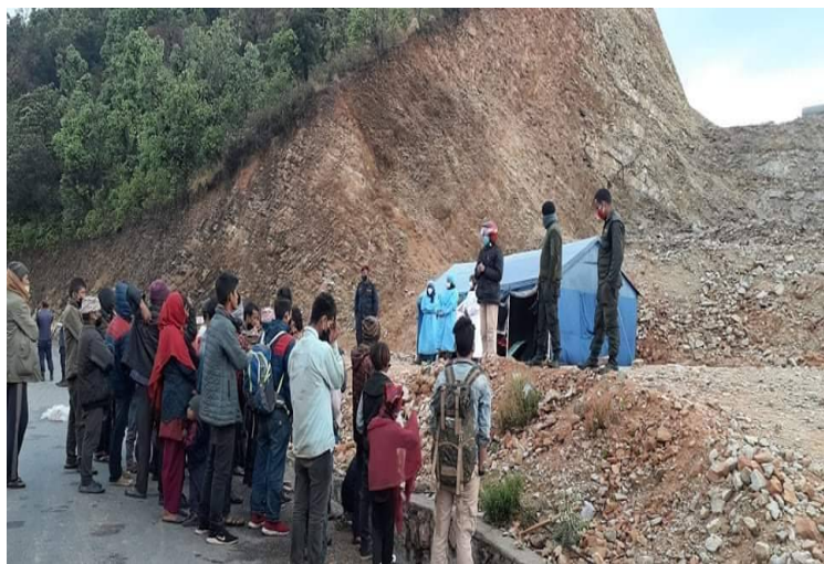
रुन्टीगढी गा.पा. होलेरीमा स्थापना भएको हेल्प डेस्क