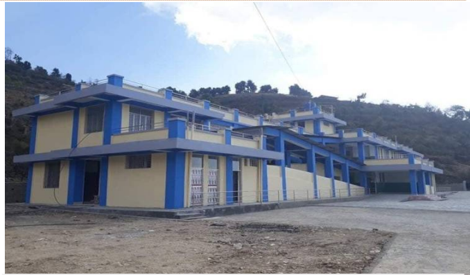
विदेश/अन्य जिल्लाबाट आएका स्थानियको लागि क्वारेन्टाईनको व्यवस्था