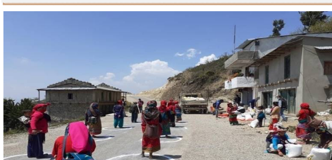
सामाजिक दुरी कायम गर्दै राहत वितरण