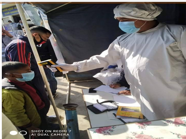
रोल्पा न.पा. ४ स्थित हेल्प डेस्कमा स्थानियहरुलाई चेकजांच गर्दै स्वास्थ्यकर्मी