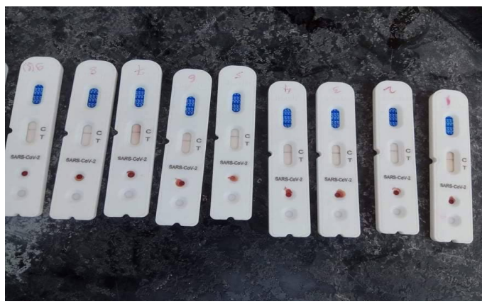
यापिड डाईग्नोसिस किट्सहरु