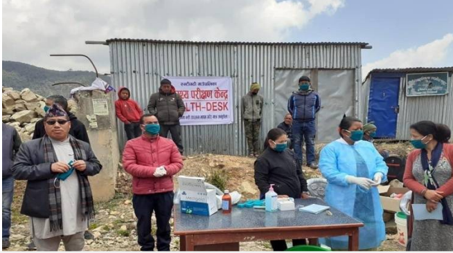
हेल्प डेस्क स्थापना