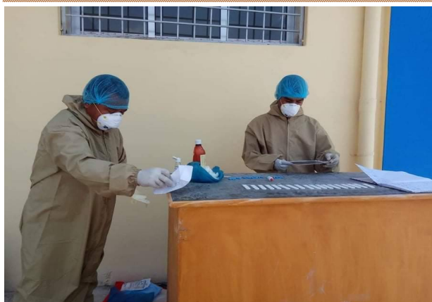
स्वाब संकलन गर्ने क्रममा स्वास्थ्यकर्मी