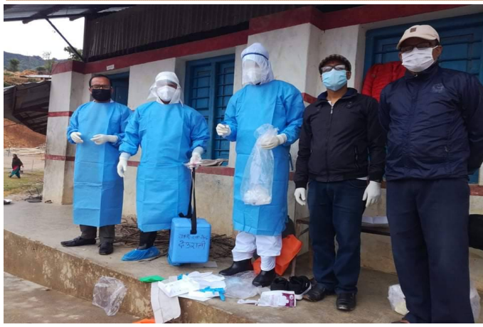
स्वाब संकलन गर्ने क्रममा स्वास्थ्यकर्मी